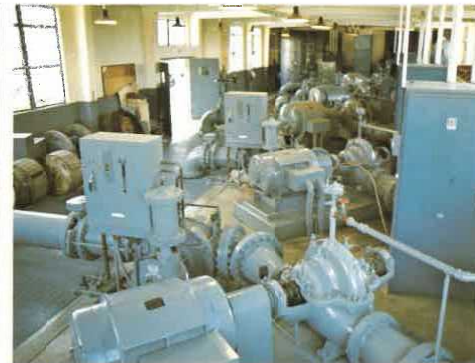
浄水池・ポンプ室