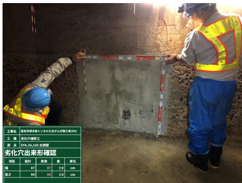
令和4年度 導水路トンネル 側壁劣化穴補修工事