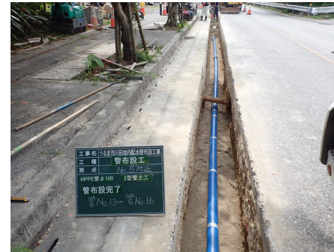
令和元年度 うるま市川田地内 配水管布設工事