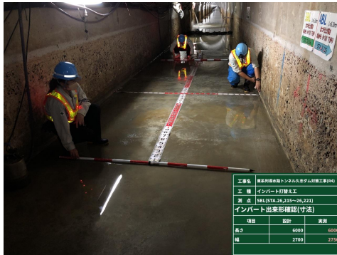
令和4年度 導水路トンネル インバート打替え工事

布設から40年以上が経過し、老朽化が進んでいることから計画的な更新を行う。併せて、管路の耐震化を行うことにより、工業用水の安定供給を図っている。