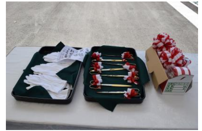
テープカット備品