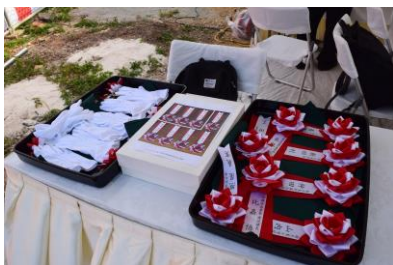
胸章・テープカット備品