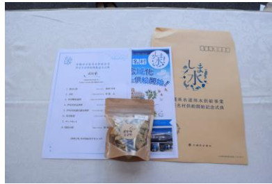
配布資料（南大東村）