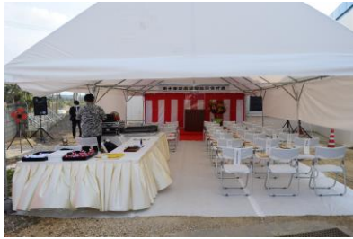
テント内セッティング