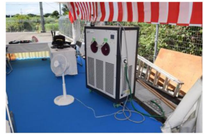
移動式クーラー（伊是名村）