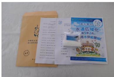
配布資料（南大東村）