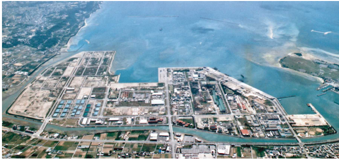
(写真)中城湾港新港地区工業団地

沖縄工業用水道事業は、水源を沖縄本島北部の多目的ダム群に求め、給水区域となる13市町村(名護市、宜野座村、金武町、うるま市、沖縄市、北中城村、中城村、西原町、南風原町、与那原町、南城市、八重瀬町、糸満市)に立地する事業所に対し、工業用水の供給を行っています。