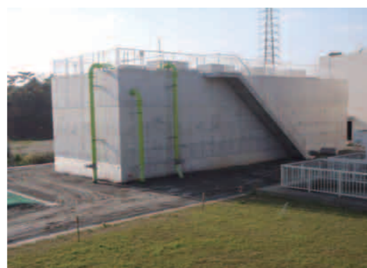
(写真) 活性炭施設の整備(新設)