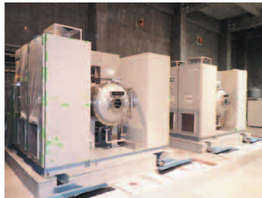
(写真) オゾン発生器改良後