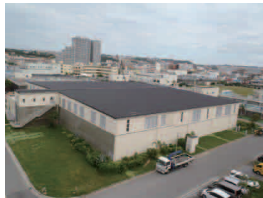
(写真) 沈でん池改良後