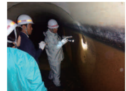
(写真) 東系列導水路トンネル内部調査状況