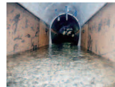
(写真) 東系列導水路トンネル内部

また、導水路トンネル改築時には、既設導水管で本島北部5ダムの水道原水を本島西海岸に迂回して水源水量を確保する予定です。