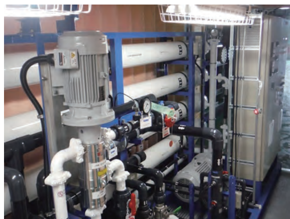
海水淡水化装置（コンテナ内）