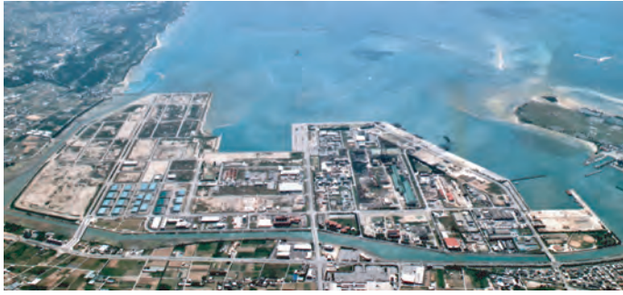
(写真)中城湾港新港地区工業団地

沖縄工業用水道事業は、水源を沖縄本島北部の多目的ダム群に求め、給水区域となる13市町村(名護市、宜野座村、金武町、うるま市、沖縄市、北中城村、中城村、西原町、南風原町、与那原町、南城市、八重瀬町、糸満市)に立地する事業所に対し、工業用水の供給を行っています。