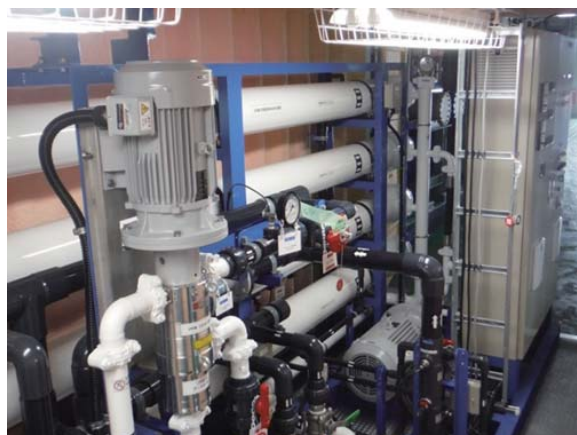
海水淡水化装置（コンテナ内）