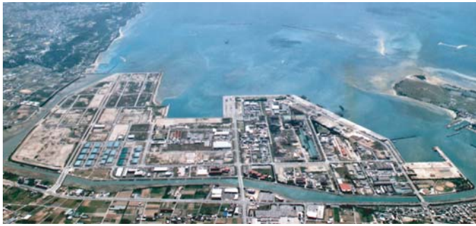
(写真)中城湾港新港地区工業団地

沖縄工業用水道事業は、水源を沖縄本島北部の多目的ダム群に求め、給水区域となる13市町村(名護市、宜野座村、金武町、うるま市、沖縄市、北中城村、中城村、西原町、南風原町、与那原町、南城市、八重瀬町、糸満市)に立地する事業所に対し、工業用水の供給を行っています。