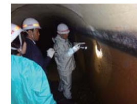
(写真)東系列導水路トンネル内部調査状況