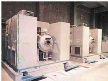
(写真)オゾン発生器改良後