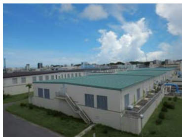
(写真)ろ過池改良後