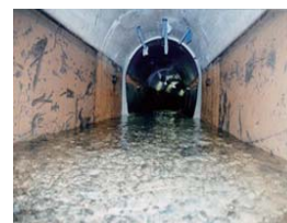
(写真)東系列導水路トンネル内部

また、導水路トンネル改築時には、既設導水管で本島北部5ダムの水道原水を本島西海岸に迂回して水源水量を確保する予定です。