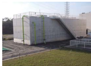
(写真)活性炭施設の整備(新設)