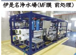
伊是名浄水場(逆浸透膜 後処理)