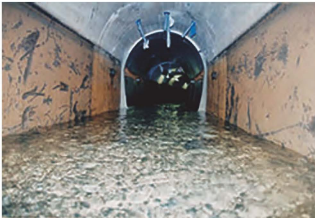
東系列導水路トンネル内部