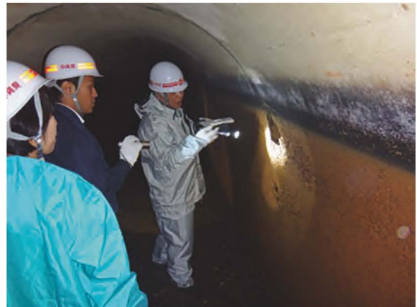
東系列導水路トンネル内部調査状況