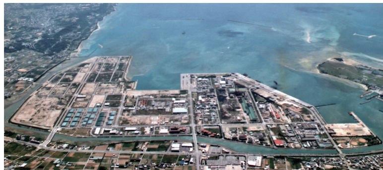
中城湾港新港地区工業団地

沖縄工業用水道事業は、水源を沖縄本島北部の多目的ダム群に求め、給水区域となる13市町村（名護市、宜野座村、金武町、うるま市、沖縄市、北中城村、中城村、西原町、南風原町、与那原町、南城市、八重瀬町、糸満市）に立地する事業所に対し、工業用水の供給を行っています。