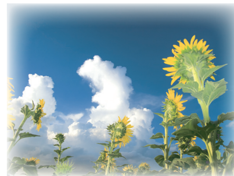
第9回沖縄の水デジタルフォトコンテスト入賞作品 優秀賞「フレイフレーあまぐも」 真栄城久美子