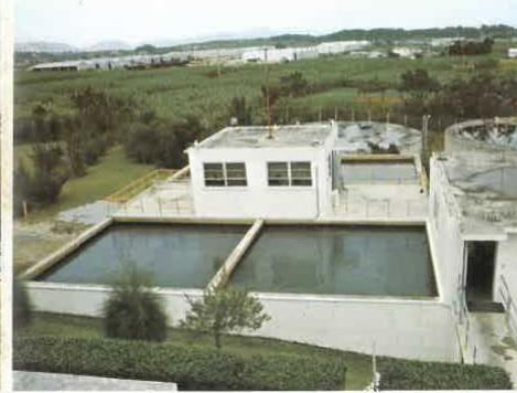
急 速 ろ 過 池