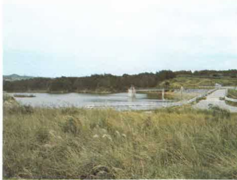
天 願 ダ ム