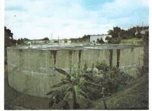
浄水池・ポンプ室